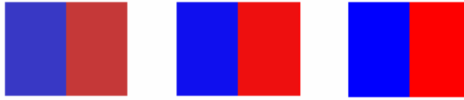
De dreta a esquerra: diferència entre poc contrast, contrast adequat i massa contrast