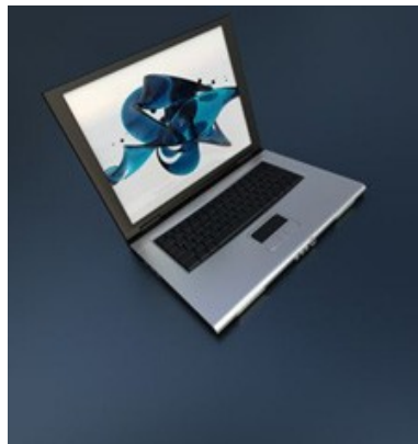
Els protectors de pantalla són animacions que s'activen quan l'ordinador està inactiu

Es van començar a emprar en els antics monitors de tub ( CRT ), en què una imatge estàtica que romangués durant massa temps en pantalla podia cremar el fòsfor que la componia i quedar-hi impresa. Per evitar-ho, el protector de pantalla l'enfosquia o mostrava imatges en moviment. Actualment, els protectors s'utilitzen més com a decoració de la pantalla, tot i que sovint impliquen un estalvi d'energia en l'aparell.