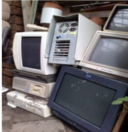
Els materials que s'utilitzen als equips informàtics i els mateixos equips generen residus

Els materials que s'utilitzen als equips informàtics i els mateixos equips generen residus . Aquests residus contenen substàncies perilloses per al medi ambient, i cal gestionar-los. Per aquest motiu s'han de dipositar als llocs apropiats de les deixalleries o als punts verds col·laboradors, mòbils o del barri.